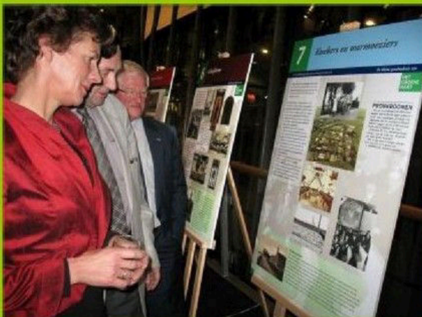
ALV HVN 10 juni 2009 Jaarverslag 2008