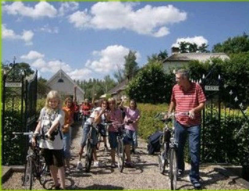
ALV HVN 10 juni 2009 Januari 2008